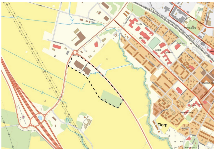
Figur 1. Ungefärlig plangräns markerad med svart streckad linje.

Planområdet återfinns i den sydvästra delen av Tierps köping, se figur 1. Planområdet ligger sydost om rondellen vilka vägarna lv 292 och Industrigatan ansluter till. Nordost om planområdet, på andra sidan lv 292, ligger området för den laga kraft vunna detaljplanen Siggbo Trädgårdsstad. Omkring 600 meter sydväst om planområdet återfinns E4:an.